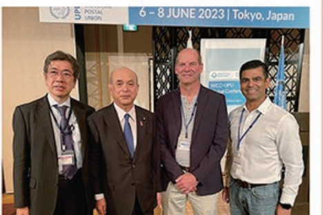
6/5 WCO-UPU グローバルカンファレンス 招宴