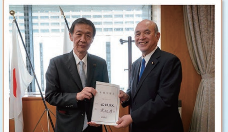
9/19 「総務副大臣事務引継式」及び 「総務副大臣・総務大臣政務官交代式」