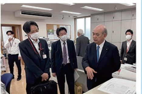
5/22 静岡県 裾野市の 郵便局視察