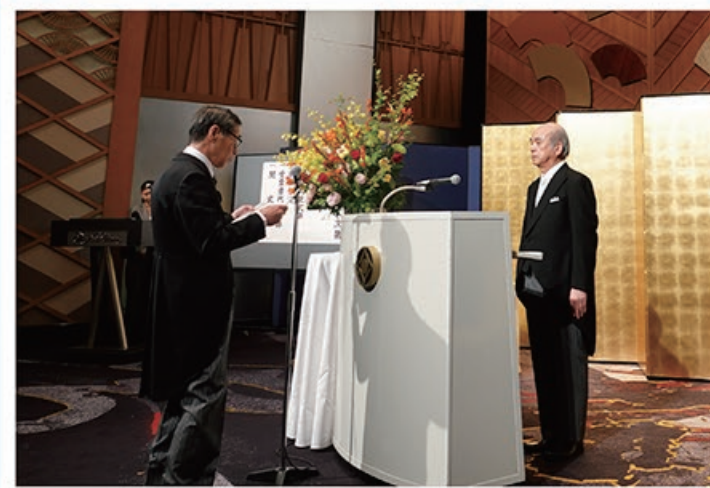
5/15 令和5年 春の褒章伝達式 統計調査、行政書士の分野において多大な功績のあった 受章者の方々に対し、褒章及び章記の伝達を行いました