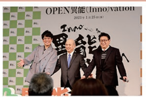
1/25 OPEN 異能vation 推進大使 “古坂大魔王”さんと

政府の一員として、総務省の代表として活動させていただきました G7、G20のサミットへの出席を含め、各団体の皆様のご理解とご協力をいただき活動しております。