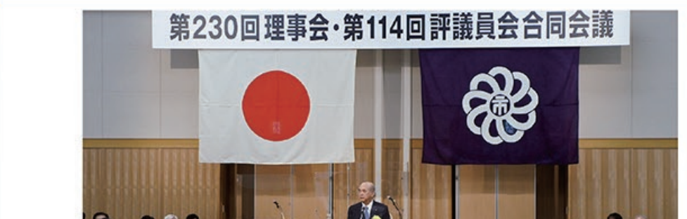
2/9 全国市議会議長会 第230回理事会・第114回評議員会 合同会議