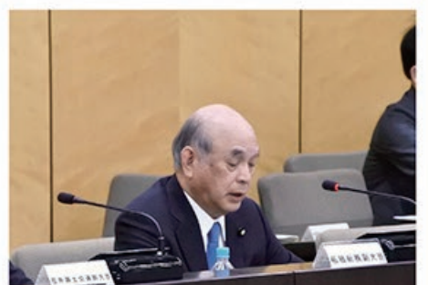
5/22 テレワーク 関係府省連絡会議 (第13回)