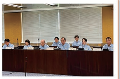
9/1 総務省非常災害 対策本部会議の訓練