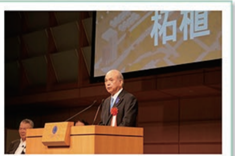
7/26 ケーブル コンベンション2023の 開会式