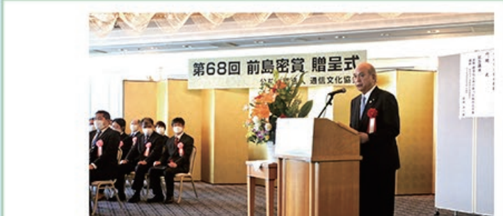
4/6 第68回 前島密賞贈呈式