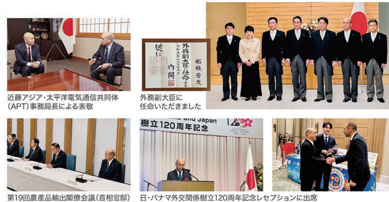
近藤アジア・太平洋電気通信共同体(APT)事務局長による表彰 外務副大臣に任命いただきました 第19回農産品輸出閣僚会議(首相官邸) 日・パナマ外交関係樹立120周年記念レセプションに出席

昨年12月14日に外務副大臣に任命いただきました。能登半島地震を受け、世界各国より連帯の意の表明をいただいております。日本国民を代表し外務副大臣として各国に謝意を述べる機会を積極的に設けたいと考えています。