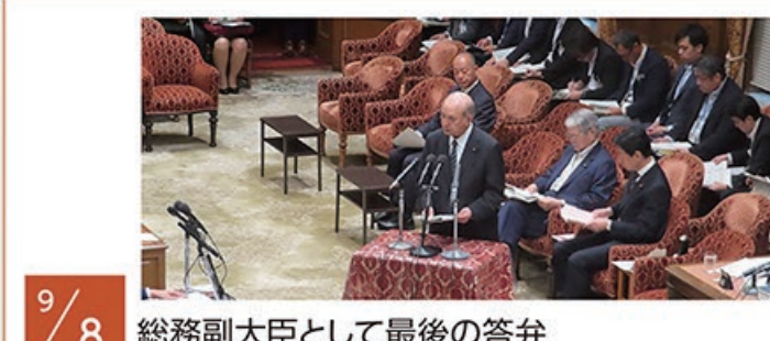
9/8 総務副大臣として最後の答弁 (衆議院 経済産業・農林水産連合審査会)