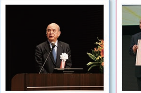
2/16 第6回 自動翻訳 シンポジウム