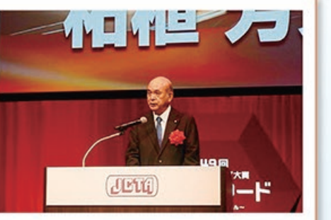
9/7 第49回 日本ケーブルテレビ大賞 番組アワード