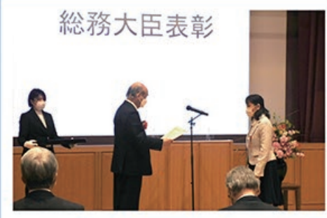
2/3 令和4年度 岐阜県統計功労者 表彰式