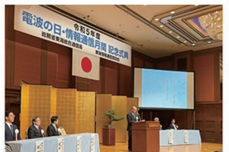
6/1 令和5年度 「電波の日・情報通信月間」 記念式典