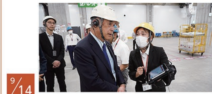
9/14 市川南郵便局へ物流システムの視察