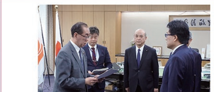
3/31 令和5年度 事業計画の認可書交付式 (日本郵政株式会社・日本郵便株式会社)