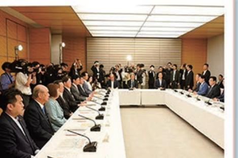
6/13 宇宙開発戦略本部(第28回) (首相官邸)