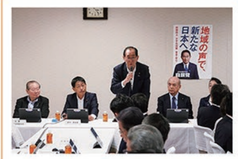
8/24 自民党総務部会 関係合同会議