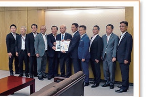
8/1 恵那市、瑞浪市 各市長 及び陳情団の皆さまを お迎えしました