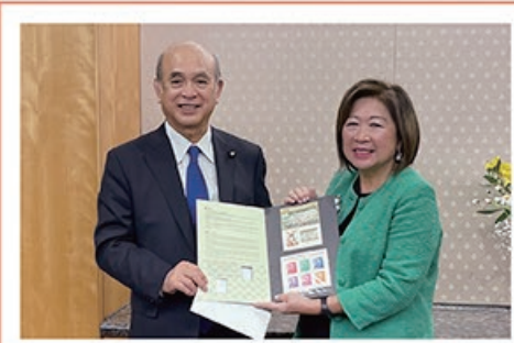
1/16 世界銀行 パングストゥ専務理事