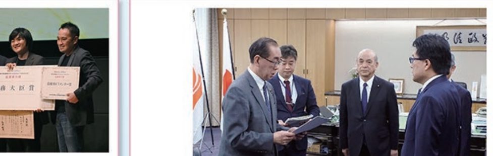
3/8 令和4年度 起業家万博 表彰式