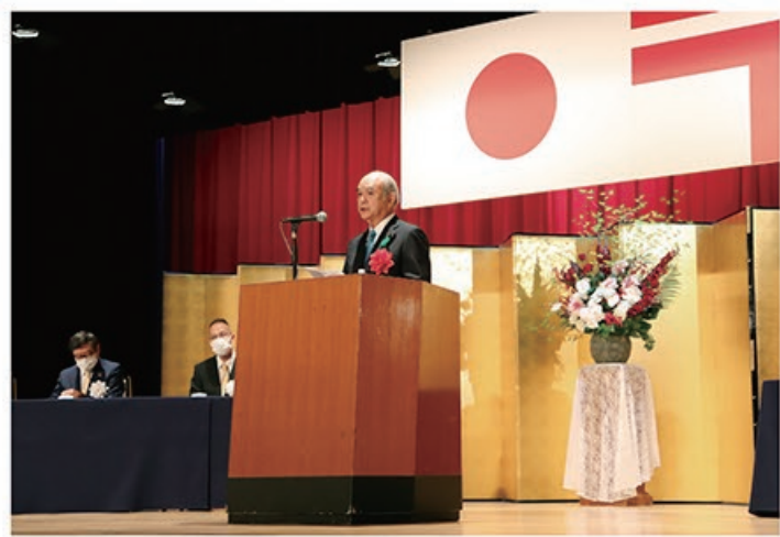
4/20 第90回 郵政記念日 中央式典 「総務大臣表彰」に日本郵便社員8名が輝き、 永年勤続表彰の代表も表彰されました

政府の一員として、総務省の代表として活動させていただきました G7、G20のサミットへの出席を含め、各団体の皆様のご理解とご協力をいただき活動しております。