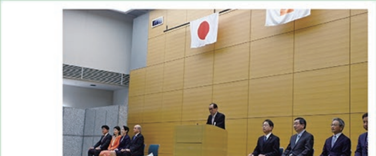
4/3 令和5年度 総務省入省式