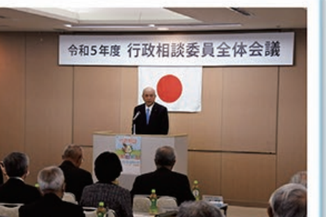
5/29 令和5年度 行政相談委員全体会議