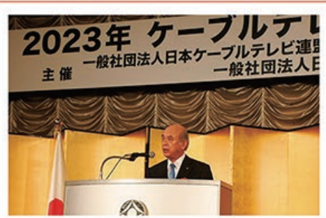
1/18 2023年 ケーブルテレビ 新年賀詞交歓会